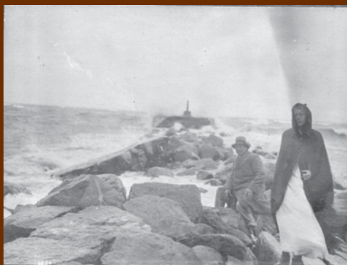
Mormor och Morfar trotsar vådrets makter på giren