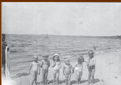
Badnyfver och pojkar på stranden, Morfar tv redde med badlakan