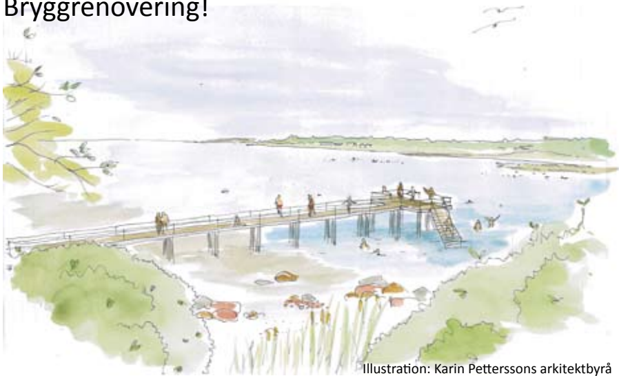
Illustration: Karin Petterssons arkitektbyrå

Byalagets största projekt någonsin , den nya bryggan, har kommit en bra bit på väg. Insamlingen av medel går ungefär som väntat, offertförfrågningar är utskickade och vi väntar på att få in priser för att förhoppningsvis kunna göra en upphandling till vintern.