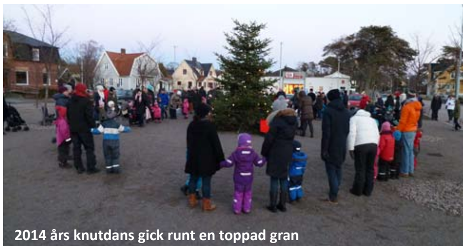
2014 års knutdans gick runt en toppad gran