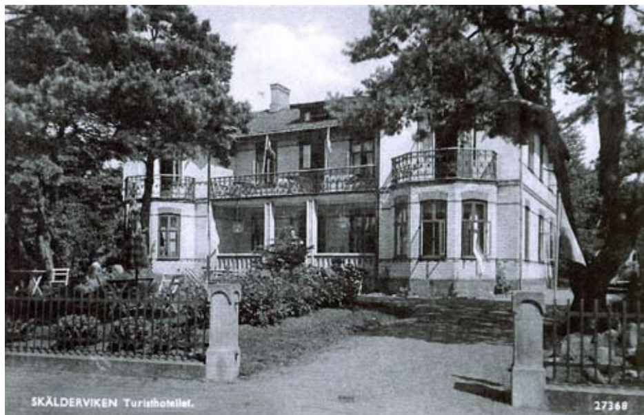
Furuborg från ett vykort från början av 1950-talet.