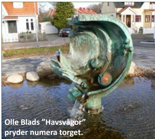
Olle Blads "Havsvågor" pryder numera torget.