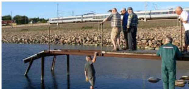
Ett enträget gäng lyckas i våras få bryggan i badbart skick.