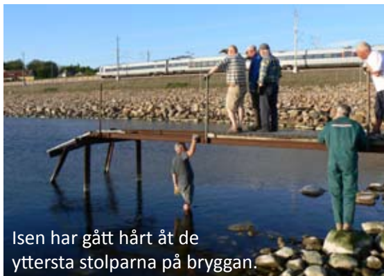
Isen har gått hårt åt de yttersta stolparna på bryggan.