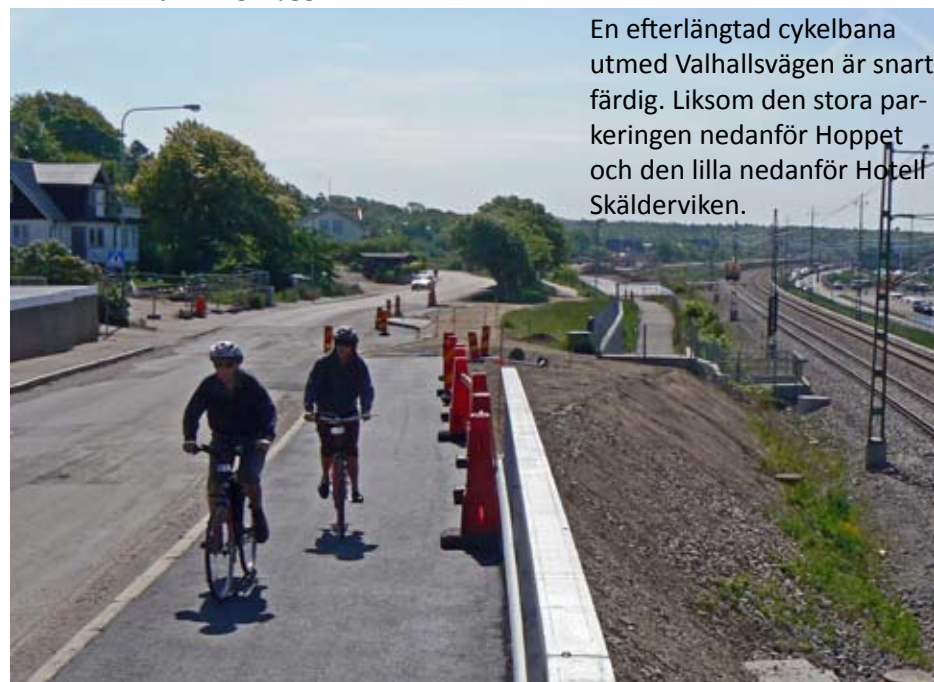
Aktuellt från järnvägsbygget

En efterlängtd cykelbana utmed Valhallsvägen är snart färdig. Liksom den stora parkeringen nedanför Hoppet och den lilla nedanför Hotell Skälderviken.