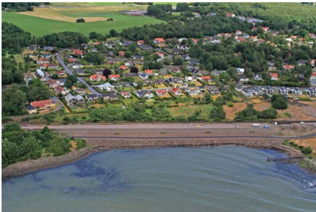
Karlskogakolonin nederst, längst till vänster. Bild: Kjell-Erik Olsson, sommaren 2008. Notera att det är betydligt fler stora träd på det äldre området Centralvägen - Vilkelvägen än på det nya mot Lingvallen.

Vår by har utvecklats från ett populärt semesterparadis till ett attraktivt åretruntboende. Det har medfört en ofrånkomlig förtätning av bebyggelsen. Om det bara inte sker alltför abrupt och alltför omfattande vänjer man sig snabbt.