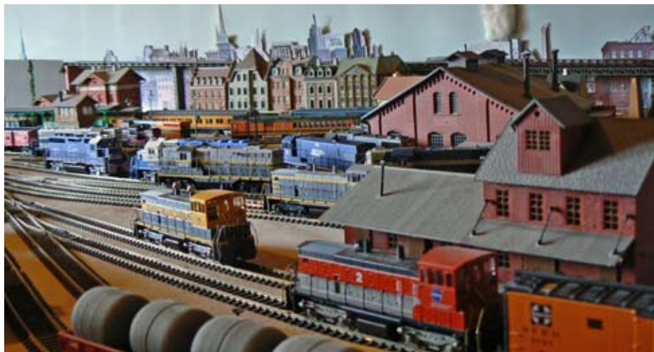
Miljöerna känns mycket verkliga.