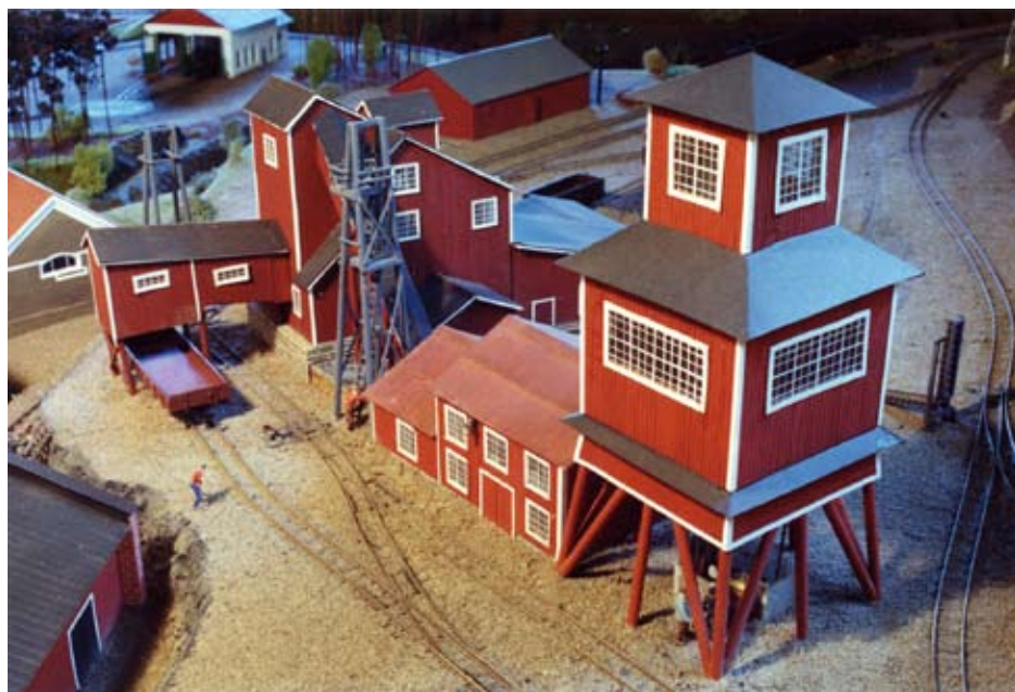
En del av Nordmarkshyttan som det såg ut på 1920-talet.